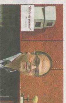
Jordi Turull PORTAVOZ DE LA GENERALITAT

«Es una provocación insostenible, no debemos tolerarla»