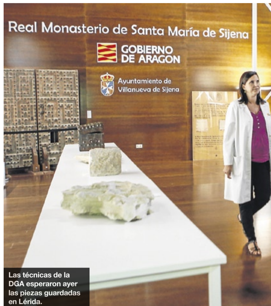
Las técnicas de la DGA esperaron ayer las piezas guardadas en Lérida.

La plataforma ciudadana Sijena Sí también emitió un comunicado lamentando que el litigio quede postergado hasta el mes de septiembre. ≡